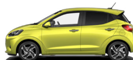
Lucid Lime Metallic Kontrastdach verfügbar