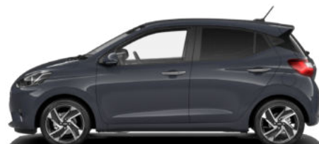
Aurora Gray Pearl