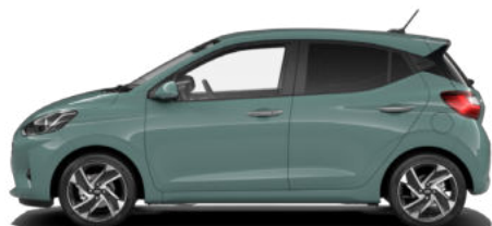
Mangrove Green Pearl Kontrastdach verfügbar