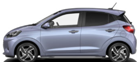
Meta Blue Pearl Kontrastdach verfügbar nicht für N Line