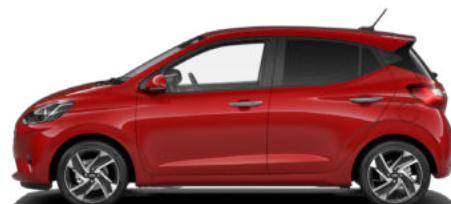
Dragon Red Pearl Kontrastdach verfügbar