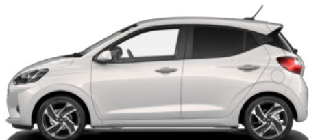
Lumen Gray Pearl Kontrastdach verfügbar