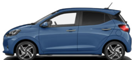
Vibrant Blue Pearl Kontrastdach verfügbar